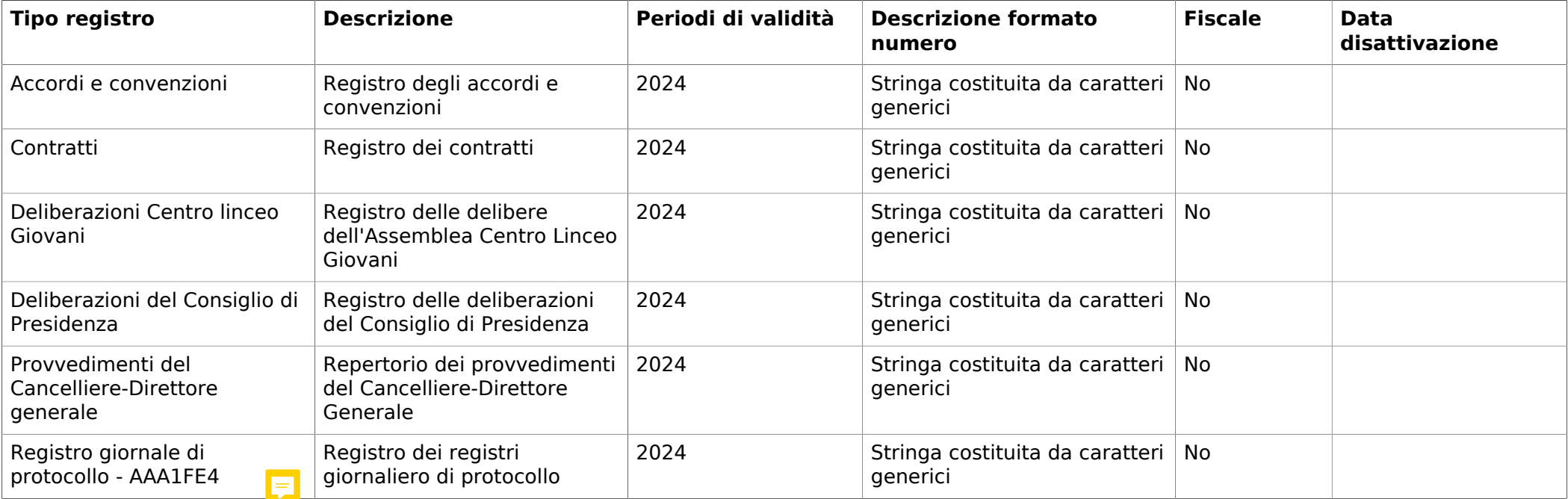
Tabella - Elenco registri

Registri - Nella Tabella Elenco registri è rappresentata la lista dei registri associati all'unità documentaria. Il nome del registro viene definito dall'Ente o concordato con ParER e in generale corrisponde al nome del repertorio in cui sono registrati in ordine progressivo i documenti ad esso afferenti (ex art. 53, D.P.R. 28/12/2000 n. 445) oppure al contesto applicativo/documentale nell'ambito del quale avviene l'assegnazione dell'identificativo progressivo e univoco. Il parametro "Fiscale" indica che le unità documentarie associate al Registro sono soggette alla conservazione di tipo fiscale, finalizzata alla conservazione a norma dei documenti rilevanti ai fini tributari in conformità con quanto previsto dalla normativa di settore vigente (DM del 17 giugno 2014 del Ministero dell'economia e delle finanze)